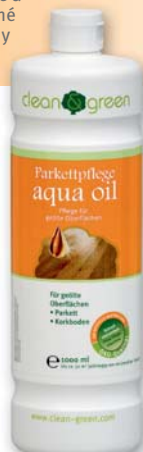
Péče o dřevěné podlahy aqua oil