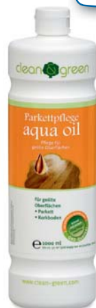
aqua oil péče o dřevěné podlahy

Na bíle olejovanou vícevrstvou dřevěnou podlahu doporučujeme aqua oil white.