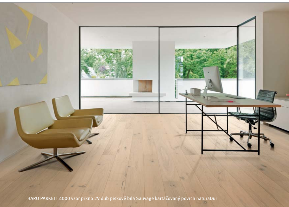
HARO PARKETT 4000 vzor prkno 2V dub pískově bílá Sauvage kartáčovaný povrch naturaDur

Hamberger Flooring GmbH & Co. KG P.O.BOX 10 03 53 83003 Rosenheim, Německo Německo